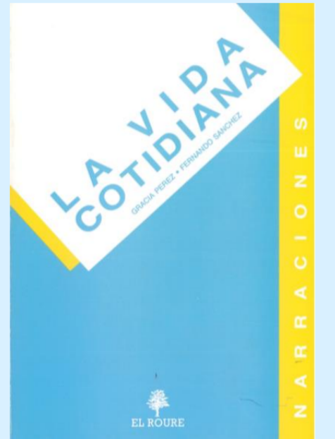
Pérez Martínez, G. & Sánchez Guallar, F., (1989), Narraciones. La vida cotidiana , Cataluña, España: EL ROURE Editorial, S.A