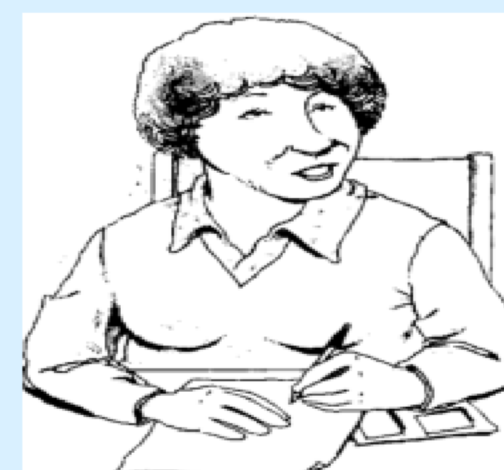
Historias de alfabetización de adultos. La palabra. Página 35

Leemos los libros, apuntamos cuántas veces se alude a las categorías propuestas y qué se dice sobre ellas.