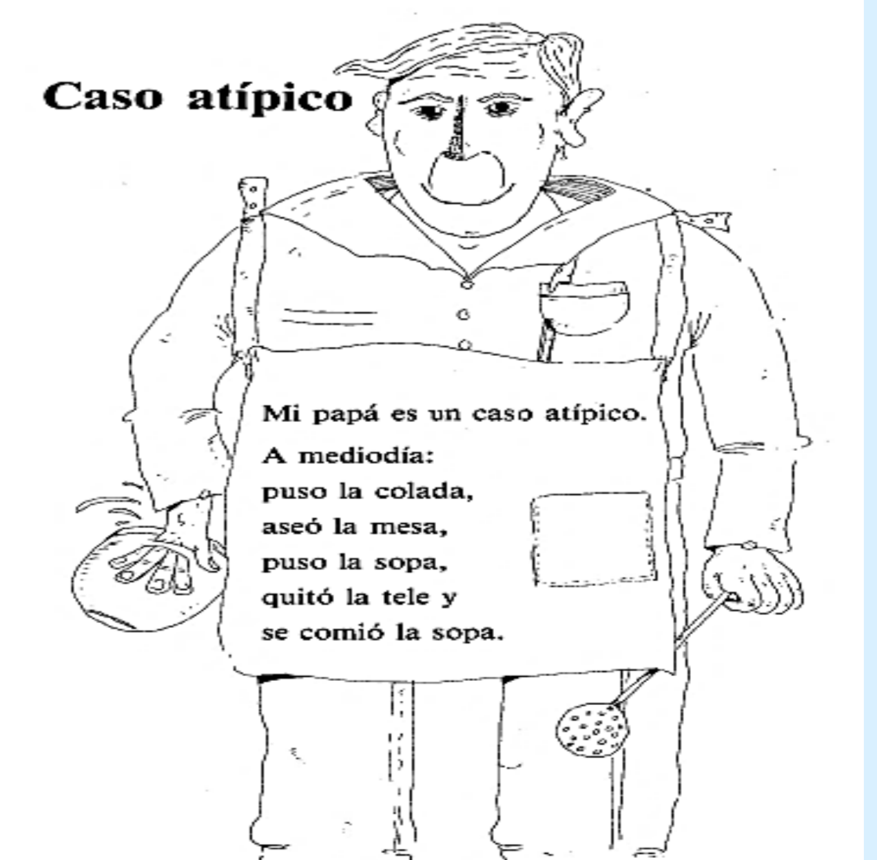
Signa. Método significativo de alfabetización de adultos. Lecturas. Página 10

La mujer comienza a considerar que ser ama de casa es un oficio. Puede trabajar fuera y comienza a interesarse por otros empleos, más allá de limpiadora o costurera. Actúa como unidad de su familia. El hombre comienza a ayudar en las tareas de casa, pero todavía es visto como algo atípico. Empiezan a tener conocimiento de todos sus derechos. Por ejemplo, el derecho a la educación o al divorcio. La religión ya no está tan presente en sus vidas. No tenía ningún problema para acceder a la cultura u otros pasatiempos, pero sí a la política.